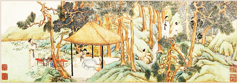
正德十三年(1518)清明时节,文徵明邀汤珍等好友前往无锡惠山游览。兴致所至,文徵明作《惠山茶会图》,记录了他们在惠山山麓的“竹炉山房”聚会畅叙友情的情景。