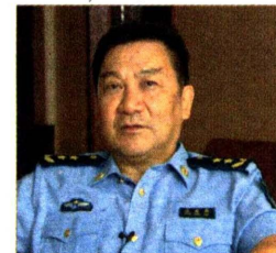
原空军副司令员,汪超群