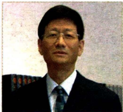
国务委员、公安部部长 孟建柱