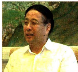
上海市政协主席 冯国勤