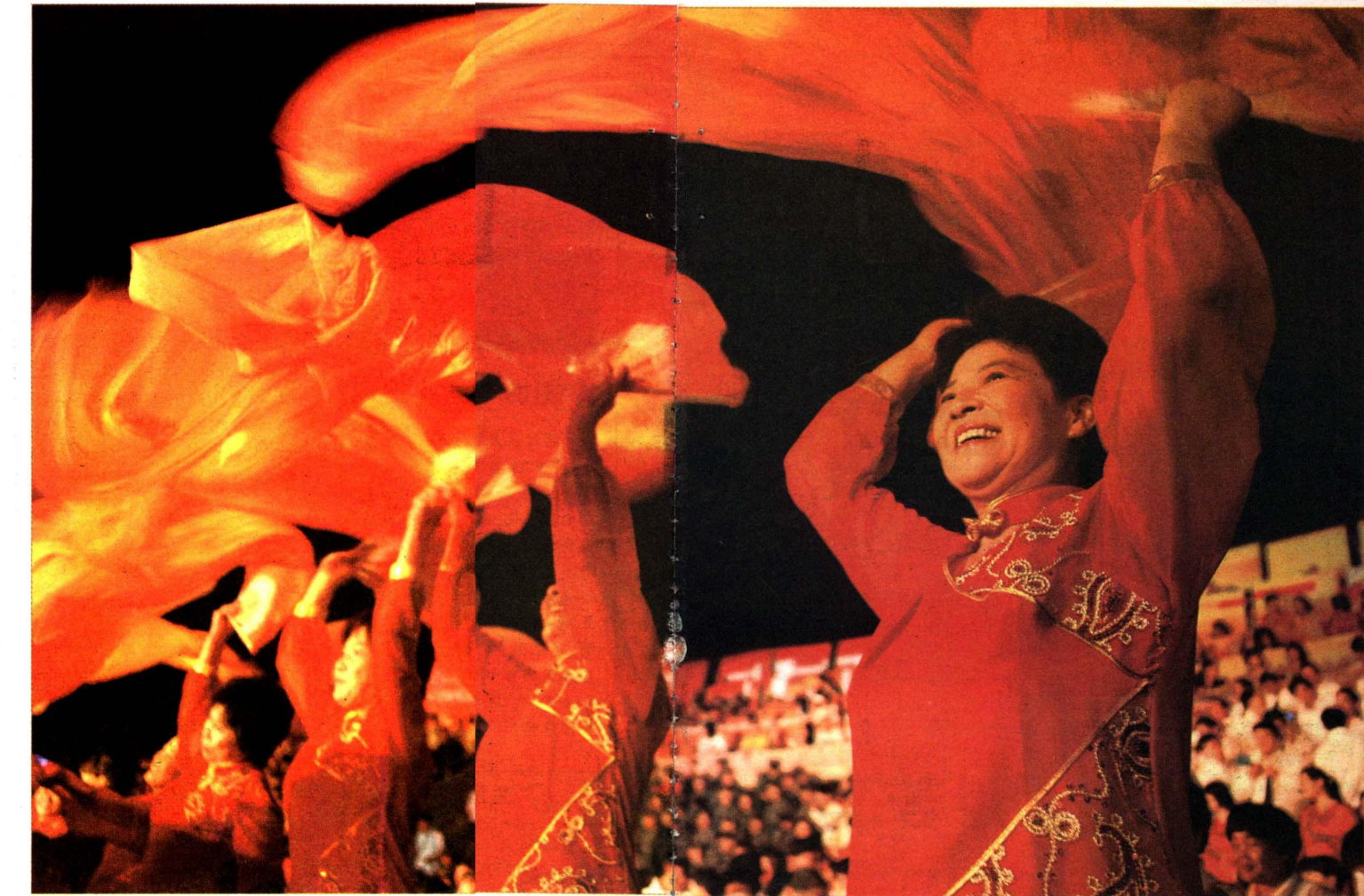
嘉定市民载歌载舞欢庆新中国成立60周年

晚会开始前,将有20位专业模特表演活体雕塑艺术。他们分别“矗立”在会场入口处和舞台上,通过各种造型表演60年来不同时期的生活场景。如果您在现场看到一座“一不小心”移动了的雕塑,千万不要吃惊。演出舞台由专业机构设计搭建,不仅灯光全部