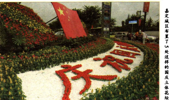
嘉定城区布置了山处这样的国庆立体花坛

同时,警方也提醒广大参加活动的市民群众,注意安全防范,携带好随身物品,服从工作人员的管理,文明参与,树立嘉定市民的良好形象。活动带来的临时性交通管制与拥堵,警方恳请广大市民予以谅解。