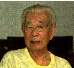
原中顾委委员、著名经济学家 于光远