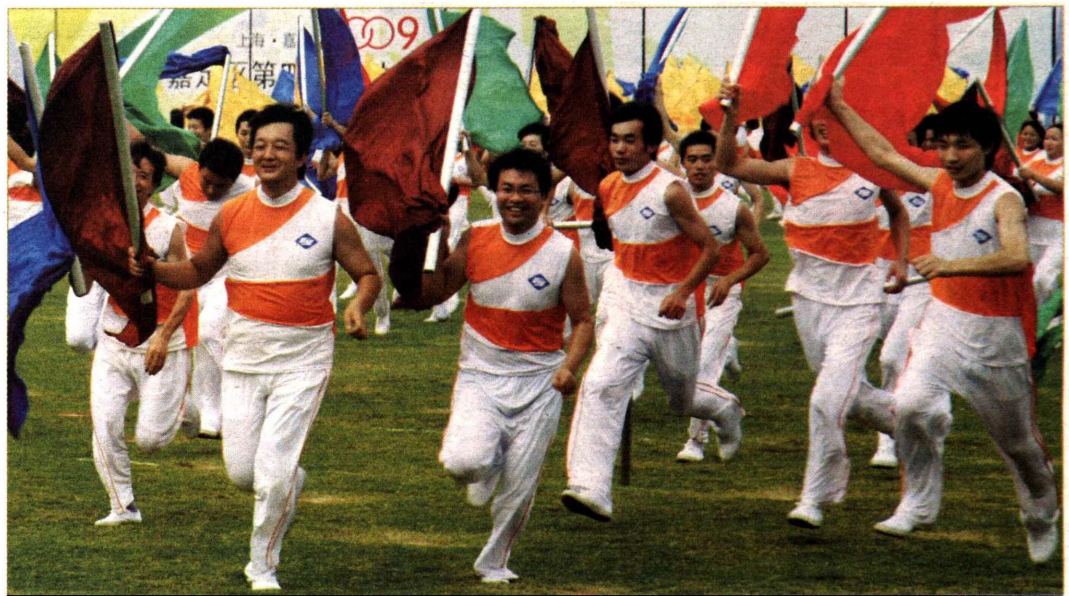
区运会开幕式团体操表演

整个开幕式直接参与人数将达1.5万人,是历届以来参与面最广、人数最多的一次。开幕式仪仗队由武警部队担当,其中,12名国旗、会旗护卫手由武警七支队三中队官兵承担,48人的红旗队由武警七支队三中队与驻嘉定某部官兵共同组建。体育场看台东南角将设置一个背景台,12幅反映嘉定全民健身成就的字画,由1292名中学生通过翻板的方式陆续呈现。