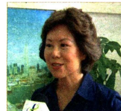
原美国劳工部部长 赵小兰