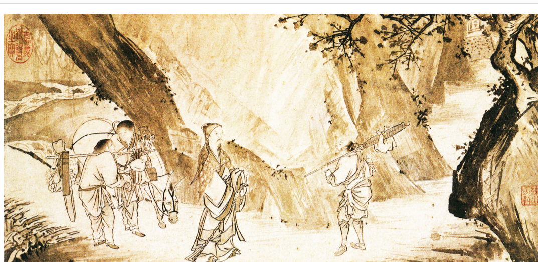
▲《归去来兮图·问征夫以前路》 马轼/绘