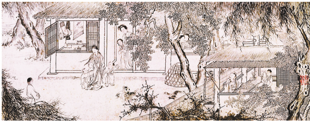
▼《归去来兮图·稚子候门》 马轼/绘

五岭瘴高烟蔽日, 两孤云湿雨鸣秋。 丰城剑气东南起, 合浦珠光昼夜浮。 祭罢鳄鱼归去晚, 刺桐花外月如钩。