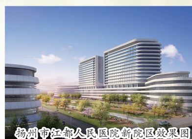
扬州市江都人民医院新院区效果图