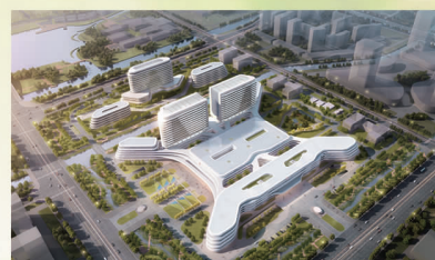
扬州市江都人民医院新院区效果图

★ 在扬州市江都人民医院就诊的患者可经“绿色通道”优先安排转诊至解放军南京总医院治疗。