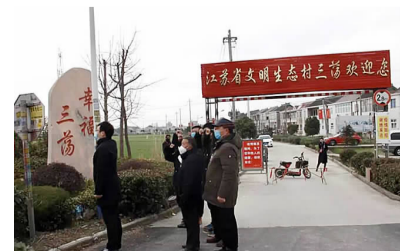
党员先锋队成员在抗疫一线宣誓