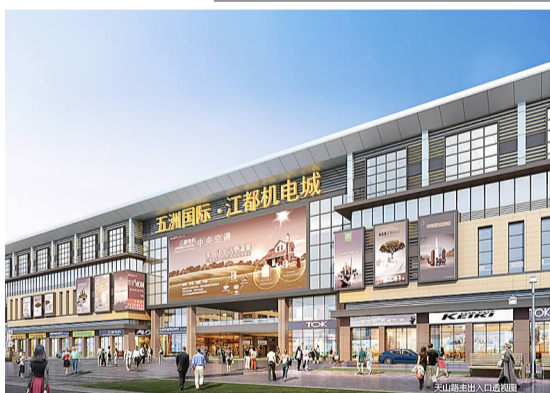
五洲国际·江都机电城效果图