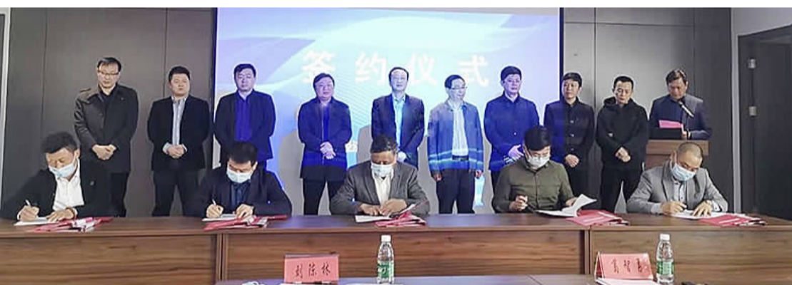
蜂谷创业园入驻企业签约仪式

强化队伍建设,紧抓“两手工程”。 坚持以党建统揽全局、以党建促进发展、以党建凝聚人心,围绕园区产业发展、项目突破等中心工作,鼓励全体党员干部争做党的建设的“旗手”和经济建设的“能手”,真正把基层党组织打造成为助推发展的“红色引擎”。积极组建党员先锋队,设立先锋岗、示范岗,在疫情防控中,商贸物流园全体党员进入“战时”状态,坚决守住疫情防控第一道关口,筑起基层防控堡垒;扎实推进“点亮支部”计划,积极开展“书记项目”,切实强化基层组织政治功能;常态化开展“每周轮学”、青年讲堂、道德讲堂等活动,不断提升文化“软实力”,真正在园区形成“党建领航,文化铸魂”的奋进生态。