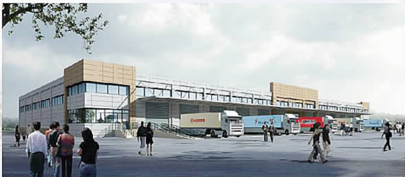
电商仓储项目效果图