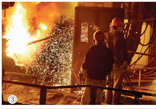
图①、②、③为金石集团不同时期的生产场景。