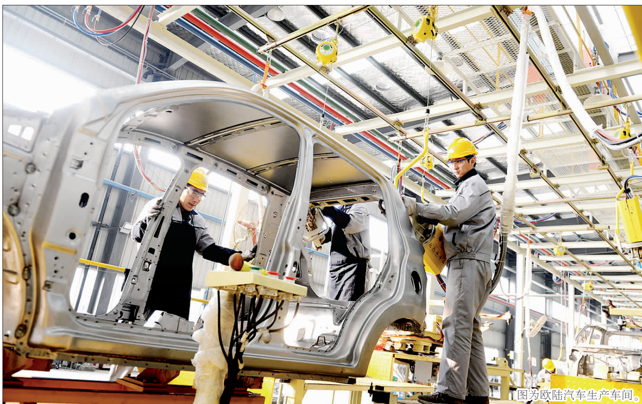
图为欧陆汽车生产车间。

典型引领示范化。大力开展学党楷模、学先进典型、学“身边好人”活动，通过选树典型，先进引导，带动党员敬业奉献，创先争优，涌现出一批国家和省、市级的先进典型，有中国好人、省市劳模、市县最美医生等，较好地树立了新时代共产党员、白衣天使的良好形象。党群共建常态化坚持抓党建、带团建、促共建，共青团、妇联、工会、计生协会、老年体协等群团组织，做到了组织健全、制度落实、活动正常、工作规范，较好地发挥了党组织的桥梁和纽带作用。（程冰）