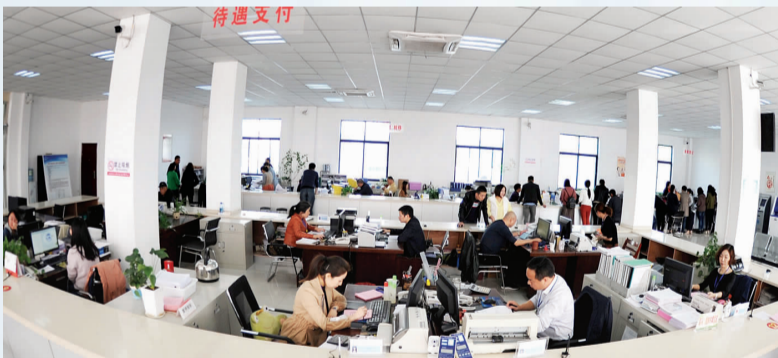
社保中心办事大厅