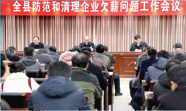
全县清理欠薪工作会议