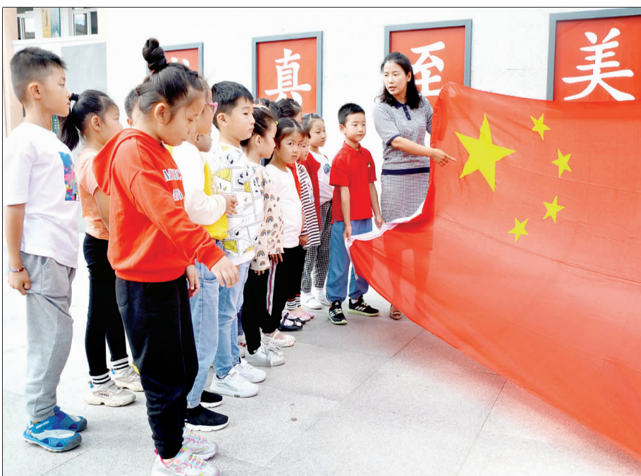
为庆祝新中国成立70周年，县实验小学组织开展了“祖国在我心中”主题教育活动，加强对学生的爱国主义和民族精神教育，引导学生树立正确的人生观、价值观，弘扬爱国精神，以丰富多彩的形式向祖国献礼。图为老师正带领一年级新生“认识国旗”，通过讲解国旗历史进行爱国主义教育。李杨 杨春 摄/文

本报讯 19日，我县组织农业技术推广中心相关技术人员、金北街道、银涂镇、塔集镇、吕良镇、戴楼街道废旧农膜回收利用工作农技人员及蔬菜种植大户赴市观摩学习可降解地膜减量替代技术。 为顺利开展我县地膜减量替代技术试验示范，验证推广新型地膜，我县组织部分相关技术人员和种植大户赴淮安蔬菜科技示范园区，现场观摩地膜减量替代技术试验示范大棚农作物。活动中，我县还邀