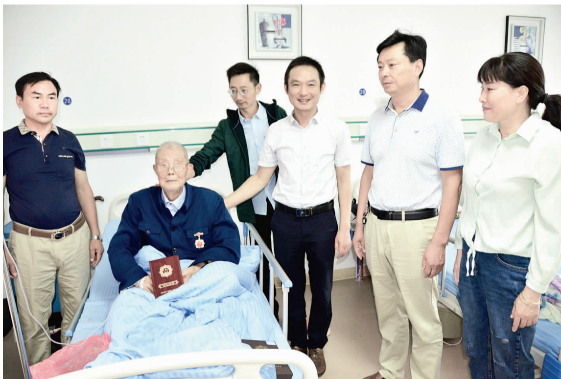
20日上午，戴楼街道为老复员军人发放《庆祝中华人民共和国成立70周年纪念章》。据介绍，纪念章发放的对象为健在的新中国成立前入伍的退役残疾军人和在乡老复员军人。这不仅体现了党中央对老战士的关心爱护，也是对他们为国家作出重大贡献的褒扬，对于加强爱国主义教育、培育和践行社会主义核心价值观、增强凝聚力具有十分重要的意义。罗德霞 杨焕新 摄/文

本报讯 为深入贯彻落实党的十九大关于加强纪律教育的精神，进一步营造风清气正的政治生态，提升纪法宣传“千百万”行动实效，20日，县融媒体中心召开党组织书记讲党纪专题宣讲会。 会议围绕“准确领会习总书记关于整治形式主义、官僚主义重要论述精神；对标形式主义、官僚主义突出问题；提升形式主义、官僚主义问题整改工作站位；领导干部要率先垂范提升工作作风”四方面内容，教育引导融媒体中心全体党员干部要提高政治站位，增强政治自觉、思想自觉和行动自觉。同时，要把“不忘初心、牢记使命”主题教育与岗位职责、当前全县重点宣传思想工作有机结合起来，做到团结一致、守正创新、融合发展、开创新局，为推动全县融媒体中心发展作出积极贡献。 又讯：20日，县融媒体中心召开“不忘初心、牢记使命”主题教育动员会。 会议要求全体党员干部要以更高的站位深刻认识主题教育是为精神补钙、为思想把舵，是为组织赋能、为执政筑基，是为党员明志、为群众谋福，是为工作提效、为事业助力，要切实增强开展主题教育的思想自觉、政治自觉和行动自觉；要紧扣主题主线，牢牢把握“守初心、担使命、找差距、抓落实”的总要求，解放思想、锤炼党性、提升作风，以更深的谋划着力提升主题教育质量水平；要注重系统推进，精心组织学习教育、深入开展调查研究、从严从实检视问题、动真碰硬整改落实，以更实的作风精准落实主题教育重点措施；要强化组织领导，以更严的要求高质量完成主题教育各项任务，加快推进融媒体中心融合发展，向新中国成立70周年、金湖建县60周年献礼。 县委主题教育第六指导组相关负责人就落实主题教育工作提出具体要求。（杨苗苗）