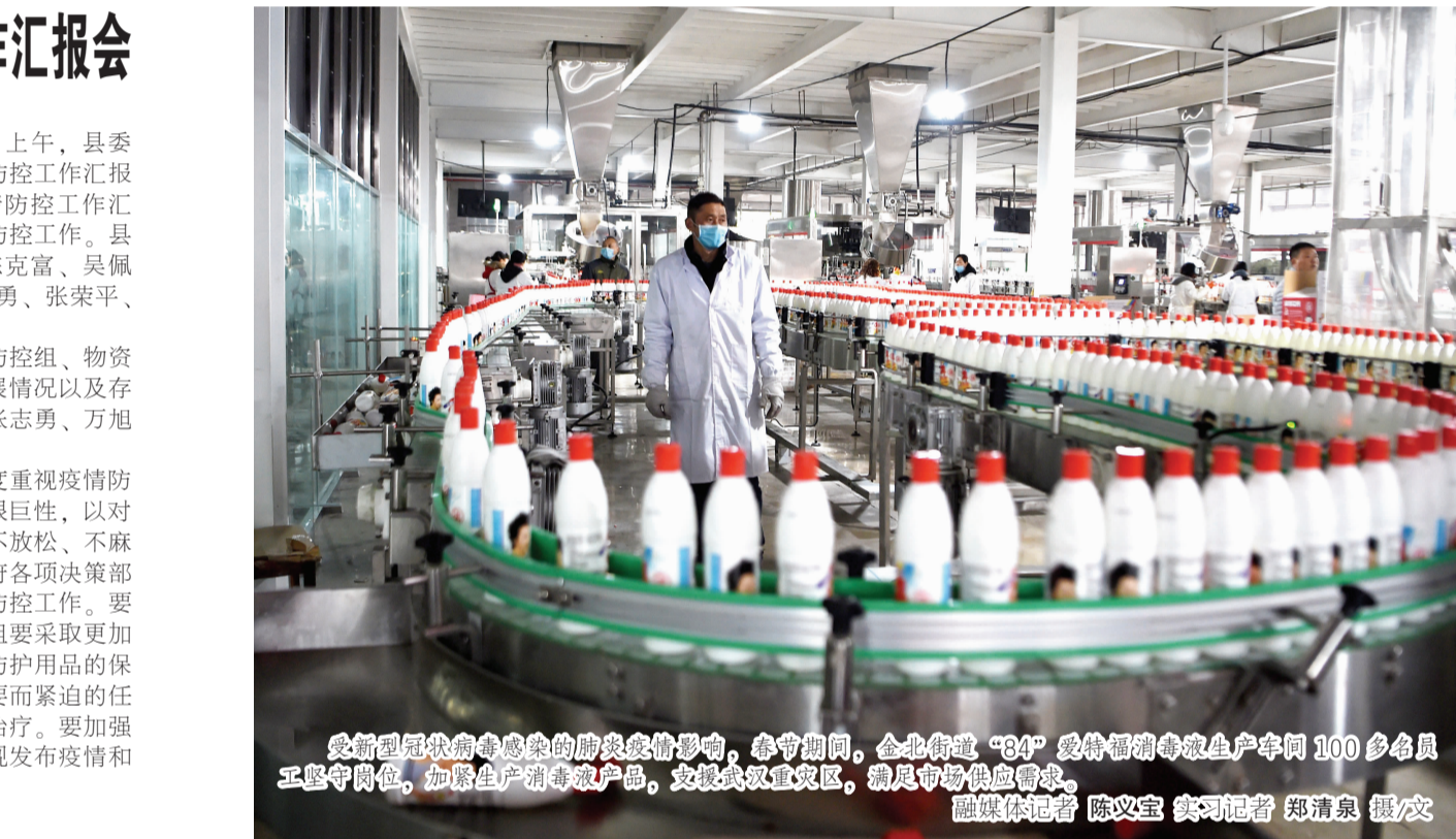
受新型冠状病毒感染的肺炎疫情影响，春节期间，企北街道“84”爱特福消毒液生产车间100多名员工坚守岗位，加紧生产消毒液产品，支援武汉重灾区，满足市场供应需求。

在听取汇报后，张志勇指出，我们要高度重视疫情防控工作，充分认清疫情的严峻性、复杂性、艰巨性，以对人民高度负责的态度增强紧迫感、使命感，不放松、不麻痹，严格落实好省委、省政府及市委、市政府各项决策部署要求，依法、科学、规范、有序做好疫情防控工作。要进一步强化防控措施，抓好落实。各个防控组要采取更加严格、更有针对性的举措联防联控。要做好防护用品的保障供应。要把重点人员摸排作为当前一项重要而紧迫的任务，切实做到早发现、早报告、早隔离、早治疗。要加强信息发布和舆论引导作用，及时、准确、客观发布疫情和防控工作信息，回应群众关切。