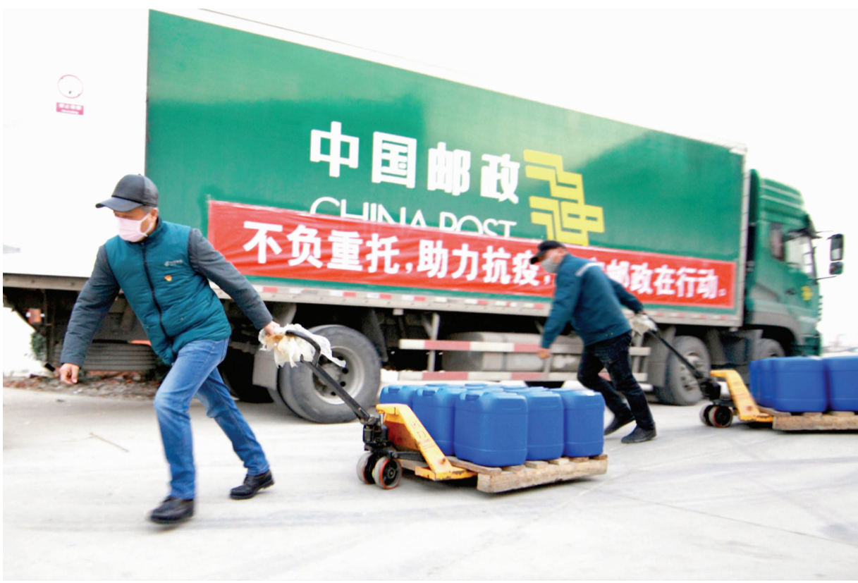
1日，县邮政分公司受市邮政分公司委托，协助将一批疫情捐赠物资（12吨消毒液）发往武汉。接到任务后，该公司立即组织人员进行作业，确保物资及时出库、装车、运送。图为作业现场。

染的肺炎疫情防控知识，通过微信群消息、打电话等方式向系统人员亲友和帮扶对象宣传新型冠状病毒感染的肺炎疫情防控常识及注意事项。加强普法宣传，避免传播谣言，防止负面舆情和谣言滋生扩散。做好疫情防控期间矛盾纠纷“拉网式”筛查，落实稳控措施，及时调处化解，严防矛盾激化，以高度的使命感和强烈的责任心保障社会稳定。 (姚彦祥)