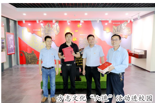
方志文化“六进”活动进校园