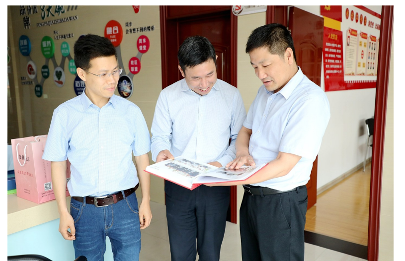
方志文化“六进”活动进社区

《金湖年鉴（2020）》出版有序推进。坚持《金湖年鉴》（2020）一鉴一鉴，公开出版。年初，印发《金湖年鉴（2020）》组稿通知，持续推进组稿工作。每月组织责任编辑就年鉴组稿工作进行讨论，交流工作方法，要求编撰人员在认真学习、掌握编纂业务知识的基础上，做好已报单位材料审核、意见反馈及修改工作，做好