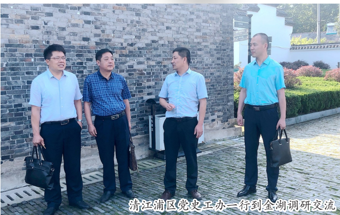
清江浦区党史工委一行到金湖调研交流