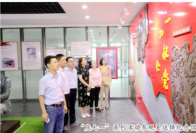
“庆七一”系列活动参观吴运泽纪念馆