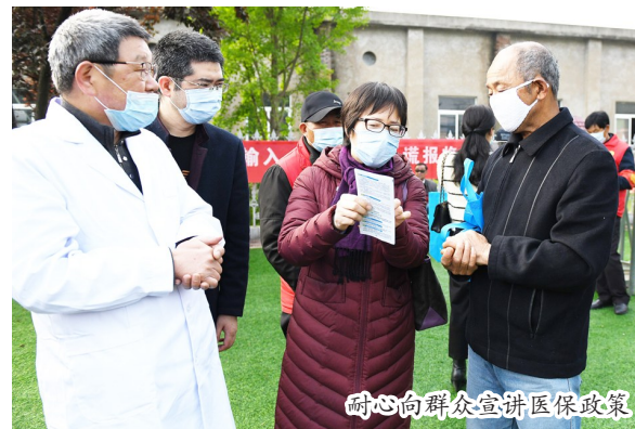
耐心向群众宣讲医保政策