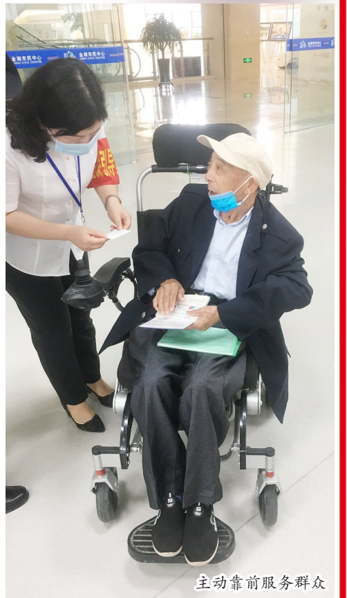
主动靠前服务群众