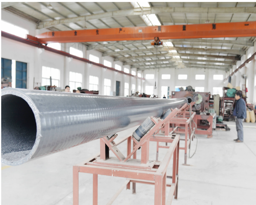
江苏宏发工程尼龙公司是专业生产销售尼龙管道、MC尼龙管道、钢衬尼龙管道、钢骨架尼龙管道的龙头企业,近年来,不断加大科技研发投入,开发适应市场的管道新品,赢得了市场先机,产品在市场上有着良好的美誉度,深受广大用户的一致好评。目前,公司生产订单已排到明年上半年。