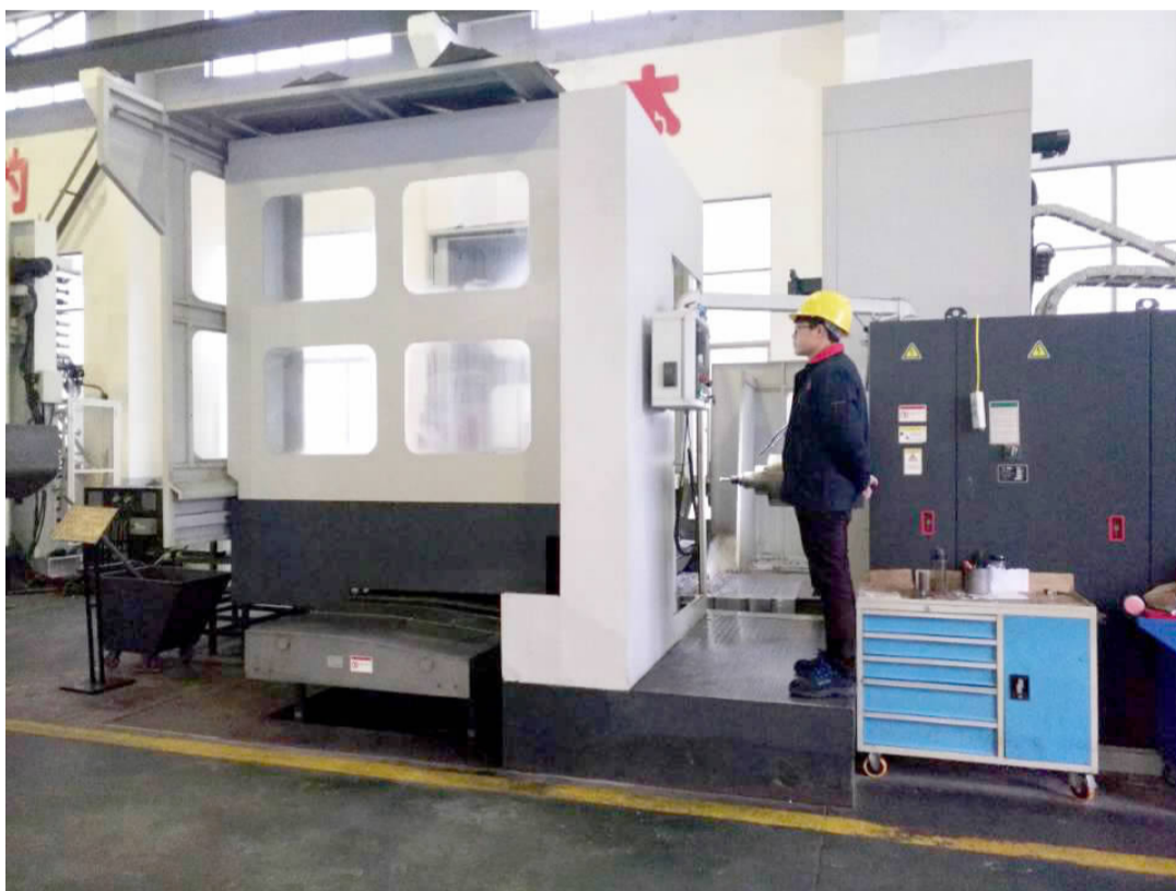
日前,记者在位于芦沟镇科创园的荣达石化公司看到,工人在各自工作岗位上有序作业,加紧生产一批发往西北的订单产品,奋力冲刺首季“开门红”。荣达公司主要生产石油机械成套设备及配件、井下工具等产品,广泛应用于油田、化工、冶金等领域,产品销售大庆、新疆、青海、辽河等油田。图为公司生产镜头。