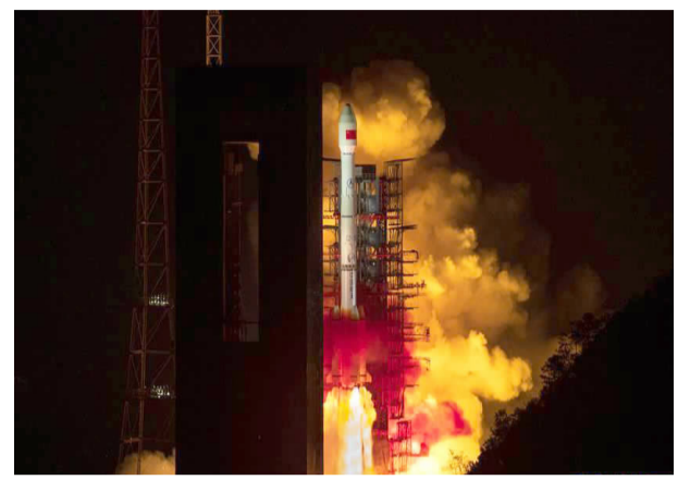
3月31日23时51分,我国在西昌卫星发射中心用长征三号乙运载火箭,将天链二号01星送入太空,卫星成功进入地球同步轨道。图为卫星发射现场。