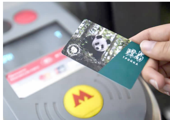
近日,莫斯科地铁开始发售印有中国大熊猫形象的交通卡,纪念莫斯科动物园建园155周年和今年4月中国大熊猫“如意”和“丁丁”入住该国。这批限量版交通卡发行量为1万张。图为在俄罗斯莫斯科,一名乘客使用印有中国大熊猫形象的交通卡出行。(新华网)

德国内政部7月10日公布首批“智慧城市示范计划”名单,入选的13个城镇将获政府1.5亿欧元支持,探索实践城镇可持续、数字化发展,并在日后交流推广经验。据了解,首批入选名单包括德国各地不同规模城镇共13个,其中规模较大的城市包括索林根、乌尔姆和沃尔夫斯堡。入选城镇设计执行的计划要满足生态、经济、社会的可持续发展要求,并利用好数字化创造的新机遇。 德国内政部长霍斯特·泽霍费尔表示,数字化改变了城镇居民的日常生活,“我们更多地上网购物,共享交通工具,改变智能手机的使用方式”。他说:“入选城镇将展示数字化转型如何改善当地人的生活。” 据了解,入选城镇需要探索并实践的问题包括新的商业区形态、数字化商业模式对公共空间的影响、新的经济就业形态对城镇凝聚力的改变等。相关经验成果需要相互交流,并向没有入选的城镇推广。(新华网)