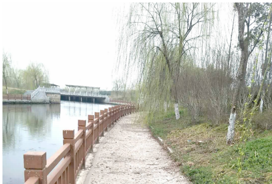
图为孟兰河水清岸绿、景色怡人。

公室,相继出台《全面落实河长制工作方案》《河长制工作实施意见》《河长制工作运行规则(试行)》等相关文件,明确主要目标、实施范围、组织体系、工作职责等内容,严格各项工作任务完成的时间节点,建立河长制工作督办、会议、信息通报、河长巡查等各项制度。 严控源头,全面提升。对区域范围内直排污染源、河岸垃圾、水产、畜禽养殖等情况进行调查,对污染原因、范围、点位做到心中有数,形成台账,并深入企业、养殖户宣传相关政策,要求其切实认清形势,增强自身环保意识,转变发展观念,按时整改到位。突出重点,强化生态河道提升工作。按照河畅、水清、岸绿的要求,该区全面启动孟兰河、李夏沟、朱尤沟等9条生态河道河坡清理及绿化提升工作。目前,方案细化工作已经完成,正在进入全面实施阶段,确保高水平高质量落实到位。 强化督查,严格考核。将河长制工作完成情况纳入年度目标绩效考核内容,采用听取工作汇报、现场检查、查阅资料、召开座谈会等方式进行督察。制