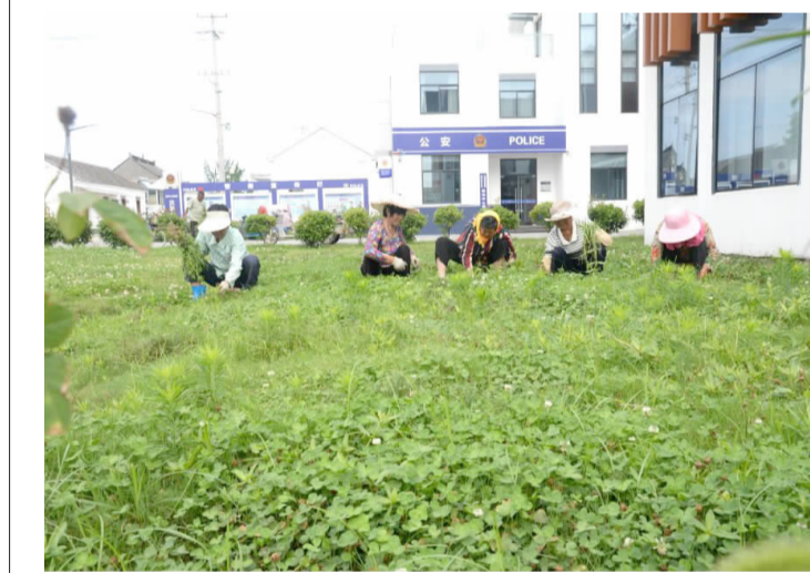
近年来,恒济镇建河村围绕乡村振兴战略要求,紧扣“做大特色产业、建设宜居村庄、弘扬文明乡风”发展目标,扎实推进田园乡村建设,着力打造活力、宜居、和谐乡村。村民纷纷表示,新农村、新面貌、新景象,让大家伙儿生活得很幸福。上图为建河村一角。左图为村民自觉维护村容环境。

本报讯 近年来,县总工会大力培树先进典型,认真做好劳模先进推荐评选工作,取得明显成效。截至目前,已推荐评选出各级劳动模范305人、五一劳动奖章300人、五一劳动奖状120个、工人先锋号182个,建成14个“劳模创新工作室”,累计发放劳模“三金”及荣誉津贴900多万元。