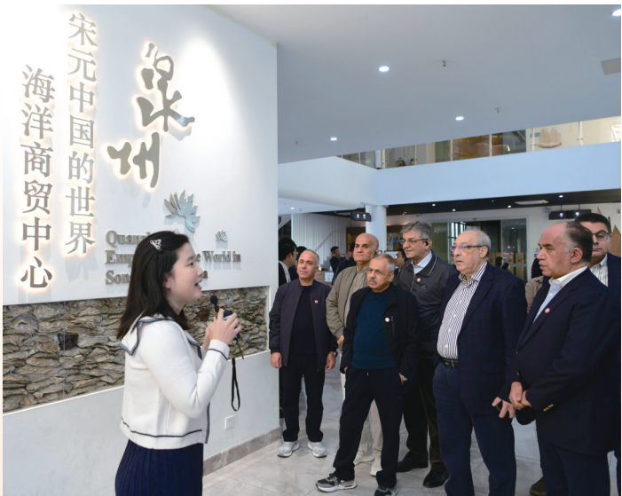
阿拉伯国家驻华使节团在泉州海外交通史博物馆参观(12月1日报)。