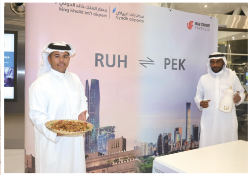
▲5月6日,工作人员在沙特阿拉伯利雅得哈立德国王机场迎接国航北京至利雅得直飞首航航班的旅客。