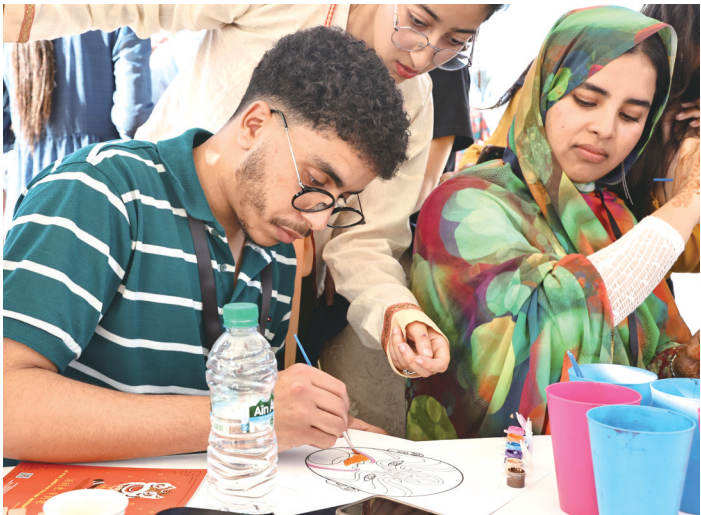
5月8日,在摩洛哥首都拉巴特,摩洛哥青年学生体验绘脸谱。