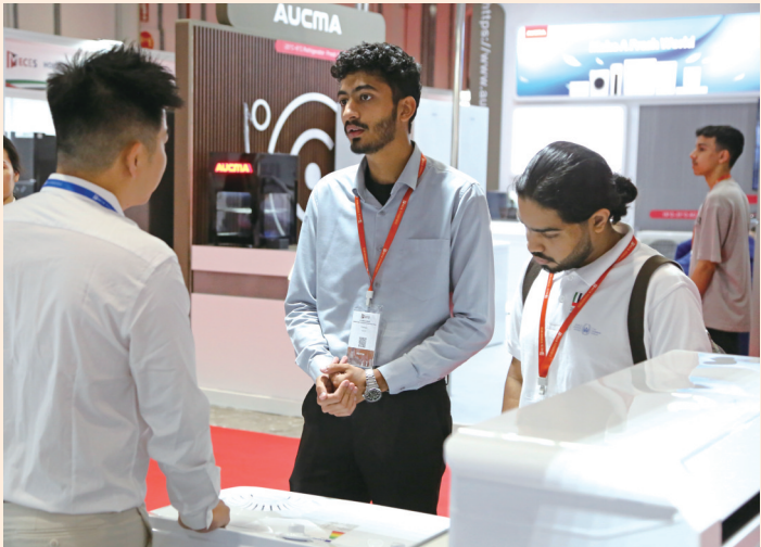
11月12日,在阿联酋首都阿布扎比,人们在首届中东家电电子展览会上交流。