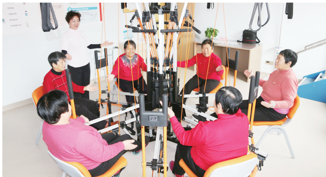
老人们体验优护万家社区居家养老服务中心设施。

我区全面提升养老服务社会化工作水平,以满足居民日益增长的养老服务需求为出发点,以实现老有所养、老有所医、老有所教、老有所学、老有所为、老有所乐为目标,大力发展老年福利服务事业,进一步提高老年群体的生活水平和生活质量。