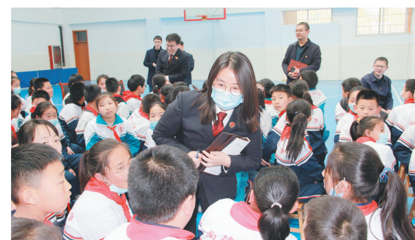
4月20日,区检察院组织干警走进尚德小学,开展送法进校园活动,推进检察队伍教育整顿工作,为群众办实事。活动现场,干警们引导同学们学法、懂法、守法,并就同学们学习和生活中遇到的问题答疑解惑、释法说理。

座谈会介绍了区公安分局公安队伍教育整顿查纠整改环节工作开展情况,与会代表们结合工作生活经历对分局打击处理、巡逻防控以及基层服务等方面公安工作谈感受、提建议。相关警种负责人就现场代表们提出的问题进行了解答、交流,形成了公安机关与人民群众的良好互动。