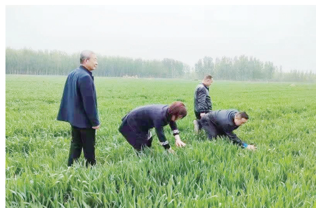
4月20日,区发展服务中心农林水事业部组织技术人员深入麦田指导小麦条锈病防治。目前,全区已建立区镇村三级联防机制,对辖区小麦地块全面普查,动态掌握小麦条锈病发病情况,通过系列措施,提高科学防治小麦条锈病水平。

工作人员通过查看资料、现场检查等方式,就如何解决消防安全问题与企业负责人面对面进行了交流,给出了具体的指导性意见。同时,指导单位加强日常的防火检查、巡查,特别是电气线路检查、维护、保养,加强对员工消防安全知识教育及培训演练,提高员工安全意识和自救自护能力,做到防患于未然,严格落实消防安全责任和防范措施,全力确保企业消防安全万无一失。