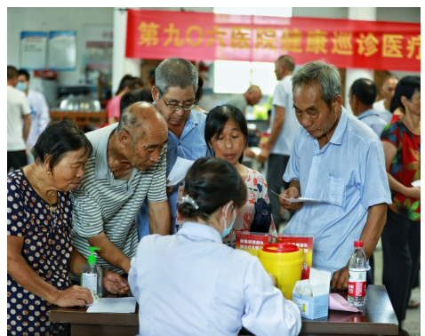
藻溪镇元店村爱心义诊现场