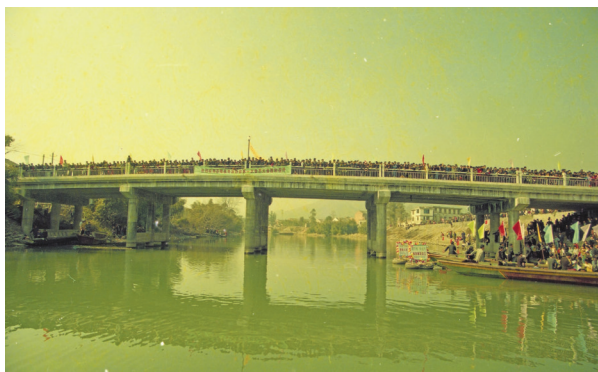
拍摄于灵溪镇晓峰村