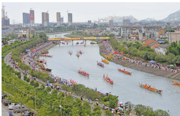
拍摄于灵溪渡龙桥