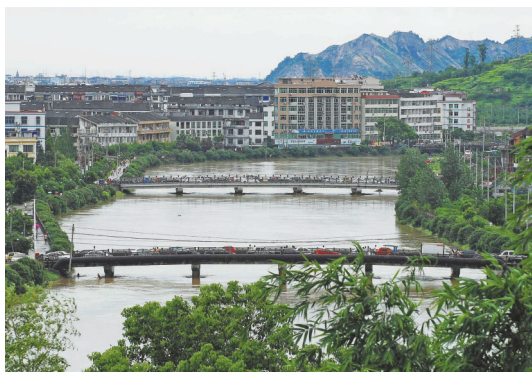
拍摄于灵溪政法桥