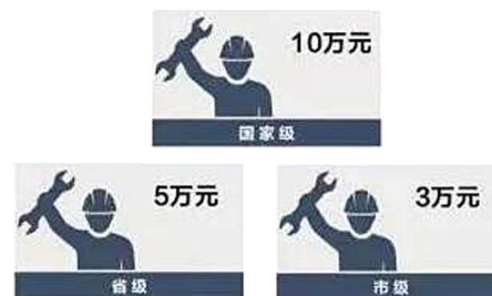
考评优秀的技能大师工作室给予最高5万元奖励