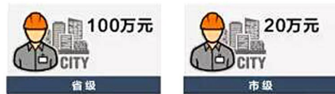
考评优秀的公共实训基地给予最高20万元奖励