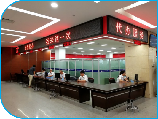
苍南县在加强涉批中介管理上具体采取了这些举措:

清理规范中介服务事项。 保留行政审批前置中介服务事项88项,申请人可自行编制19项,共计107项,其中改由审批部门委托事项20项,涉及安全强制性评估3项,取消或调整22项。