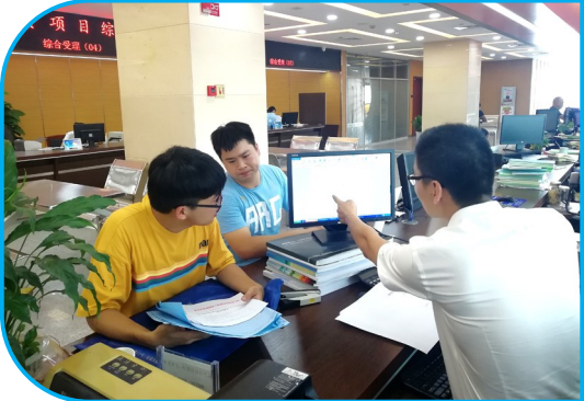
投资项目综合窗口工作人员为项目提供助办服务