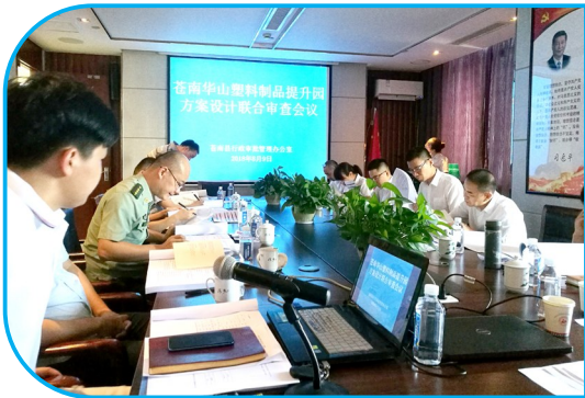
苍南华山塑料制品提升园项目方案设计联合评审会现场

但是,从企业投资项目审批看,简易项目50天涉批中介占了36天,一般项目82天中介占了66天,中介服务时间占了全流程70%;从实际审批项目分析看:方案设计、施工图设计等超时较为明显。于是,我县于日前召开全县净化招投标市场和强化标后管理大会,深化“最多跑一次”改革向涉批中介延伸,在标准不变、质量不降情况下落实我县工程领域审批验收双提速,全面推进投资项目审批改革走在全省前列。