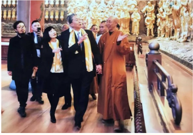
林华能陪同日本前首相鸠山由纪夫参观福州万佛寺