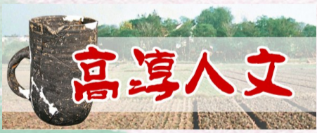
图文摘自《高淳历史文化大成》

顺序,不得恃强争夺,而未捐钱之船,则不得停泊。又恐年久遗忘,事成之后,两帮于乾隆三十一年八月共立《创建马头碑记》一碑以示后人,此碑现存保圣寺塔园。据碑文开列的创建码头的银款,有买田、请示税契、生歇侯捐船、安土设酒、立碑、存地主生息纳银、开河诸项。此外,还有“演戏完工银十五两”,说明当初码头告竣之际,武阳两帮曾邀戏班演戏,以示庆祝。