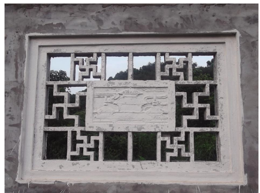
右左旋结合的黄岩广化寺围墙窗饰。