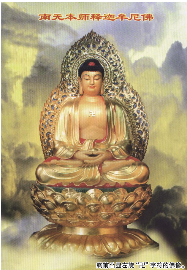
胸前凸显左旋“卐”字符的佛像。