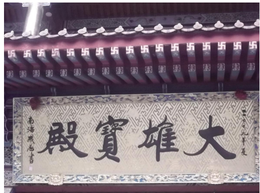
右旋字符的黄岩广化寺大雄宝殿椽头。