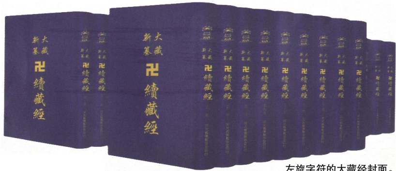
左旋字符的大藏经封面。

走进寺院, 观见佛祖, 稍加注意, “卍”字胸标呈现眼前。其书写有左旋“卍”(即逆时针)字, 也有右旋“卐”(即顺时针)字, 两者并用。