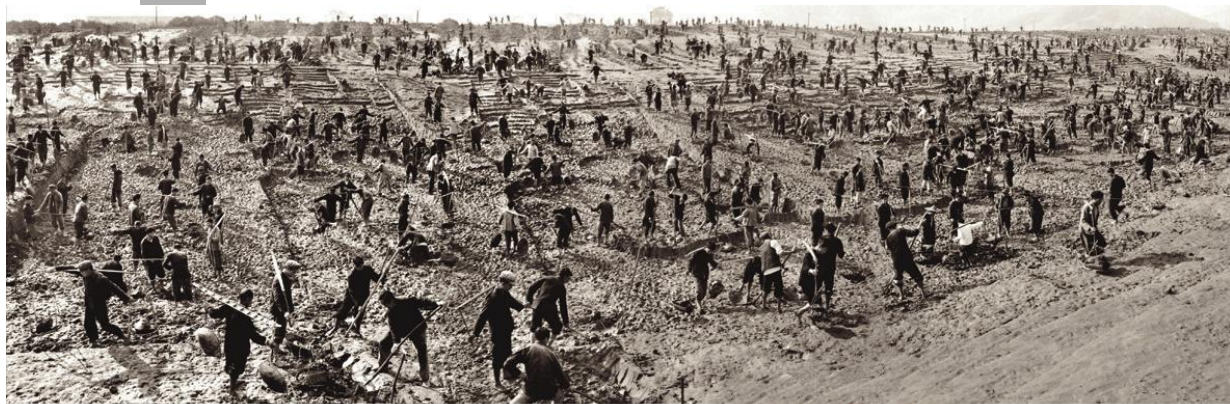
1973年，4万干部社员和居民群众，自筹资金，自带粮食被褥，在工地安营扎寨奋战40多天，投入140万人工，截弯取直永宁江上游，提高防洪排涝能力。