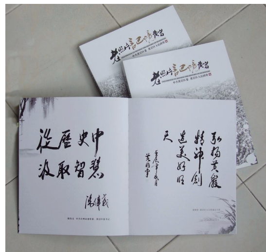
《老照片记忆黄岩》画册中领导题词。

捧读这本弥足珍贵的历史画册，我们从中汲取智慧，受到激励、鼓舞、教育和启迪，从挫折、失误中感受警示，获取继续前进，创造新辉煌的动力。