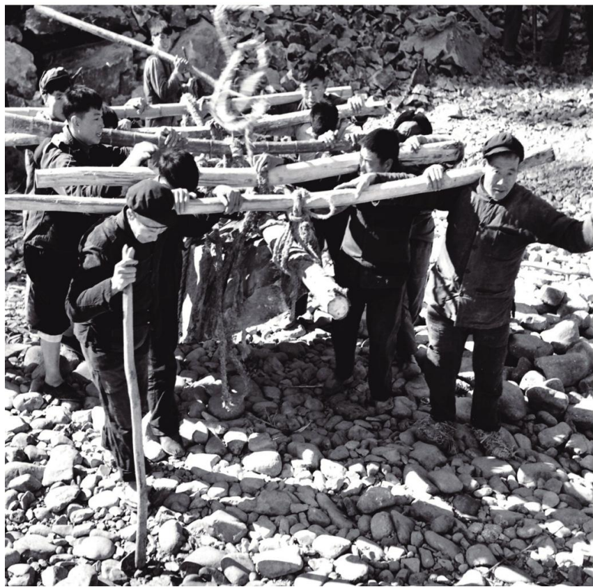
1975年，长潭公社委委大队改溪滩治恶水，扩大良田面积，干部群众齐心协力，勇挑重担，成为全县自力更生、艰苦奋斗的典范。