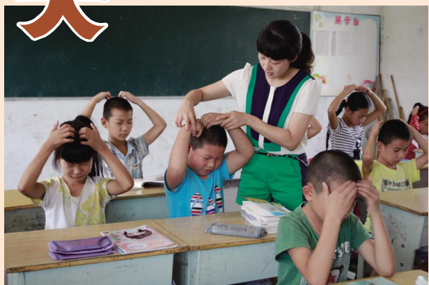
⑤ 10 时 20 分，她回到教室，指导学生做眼保健操。