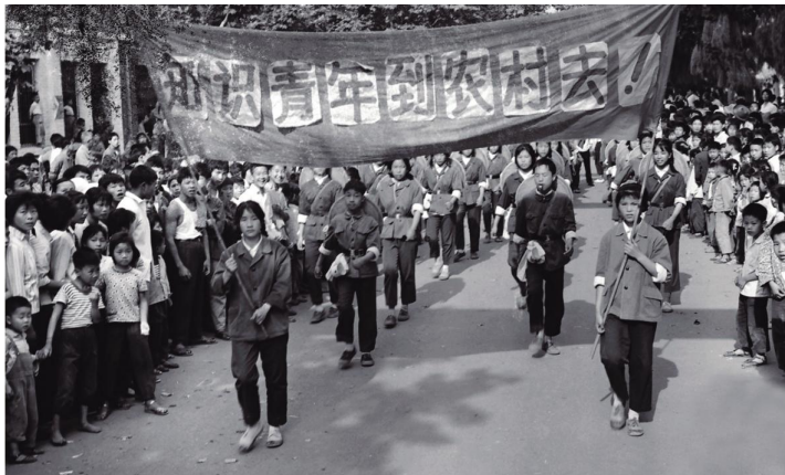
▲1966年,知识青年上山下乡运动大规模开展。此照片为黄岩老三届知识青年出发赴农村插队时的情景。