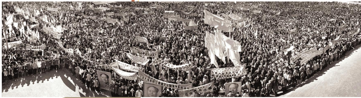
▲1976年10月,党中央一举粉碎了“四人帮”反革命集团,结束了“文化大革命”这场十年动乱。全县数万群众在黄岩中学操场集会,欢庆伟大胜利。