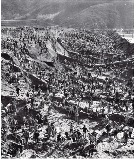
▲1971年,西溪水库广大民工艰苦奋斗,力争提前完成水库建设。

展现在眼前的几幅照片,是五六十年前一些稍纵即逝的新闻照片,经过时间的洗涤和沉淀,却成了具有永存价值的、弥足珍贵的历史见证物。翻开叶心源老先生拍摄的老照片,它将给我们带来一次难忘的真影追忆,走进那段尘封的历史。