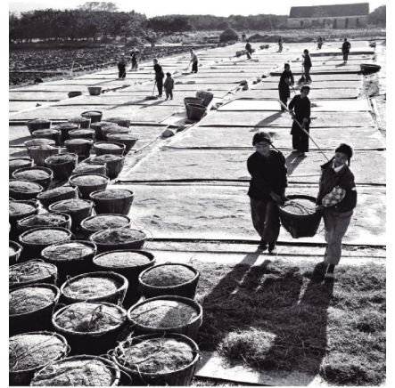
▲1975年,浙江省粮食单产第一个超双千的王林乡下洋顾大队良种加良法,晒谷场上一片丰收景象。