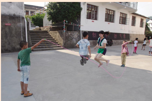
⑥ 15 时 20 分，体育课，她参与到学生的体育活动中去。