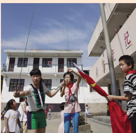
③ 9 时 20 分，她帮助学生升国旗。