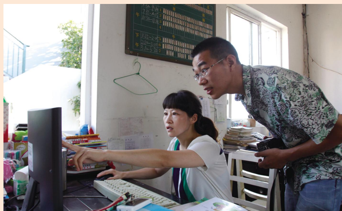
④ 课间 10 分钟，她和同事讨论教学中遇到的一点小问题。