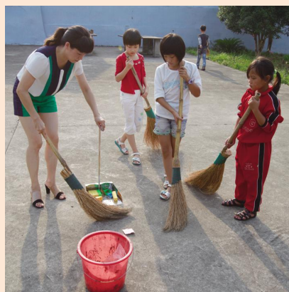
⑦ 放学之后，她和值日生一起打扫卫生。