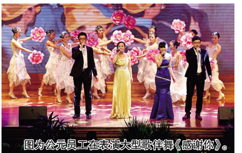
图为公元员工在表演大型歌舞《感谢你》。

当公元集团从一棵小树苗长成了参天大树的时候,张建均也成长为远近闻名的企业家,他致富思源,不忘回报社会。由于成绩突