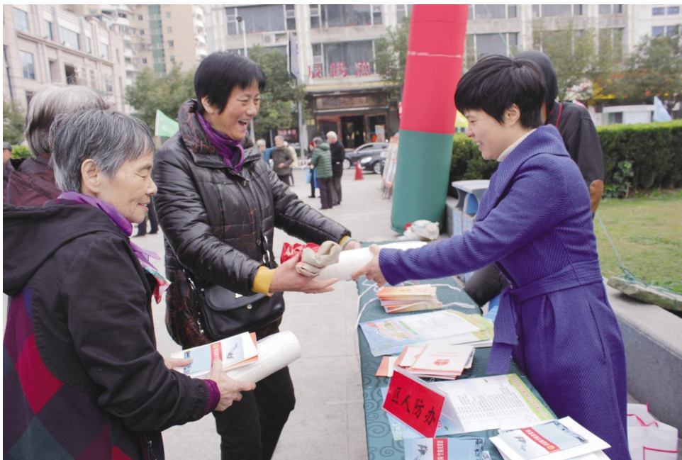
12月4日上午，区人防办结合“12·4”全国法制宣传日在北门广场开展了人民防空法律法规宣传活动。