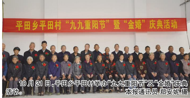
10月21日,平田乡平田村举办“九九重阳节”暨“金婚”庆典活动。