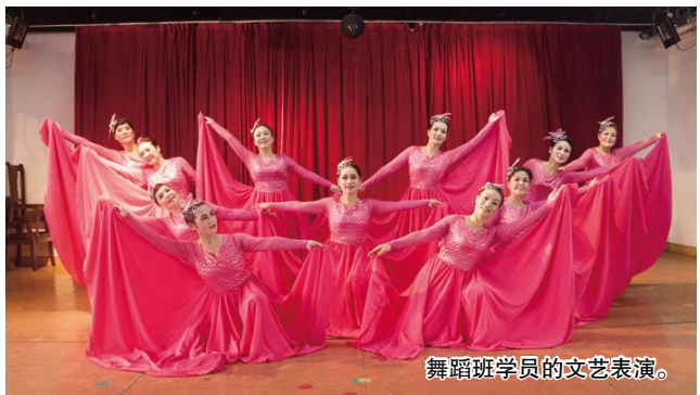
舞蹈班学员的文艺表演。