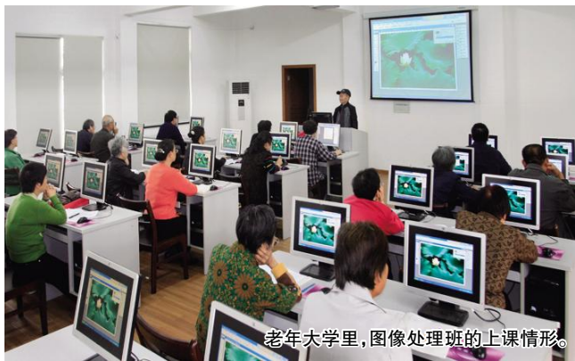
老年大学里,图像处理班的上课情形。