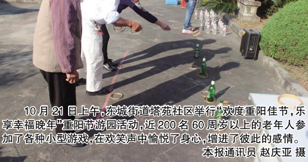
10月21日上午,东城街道塔苑社区举行“欢度重阳佳节,乐享幸福晚年”重阳节游园活动,近200名60周岁以上的老年人参加了各种小型游戏,在欢笑声中愉悦了身心,增进了彼此的感情。