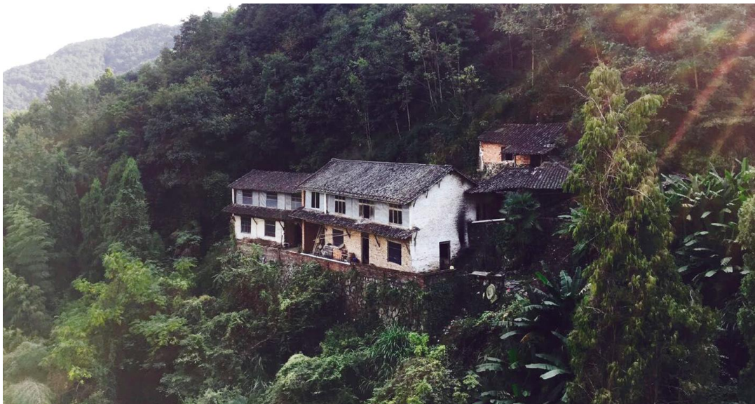
「散落在山中的人家。」