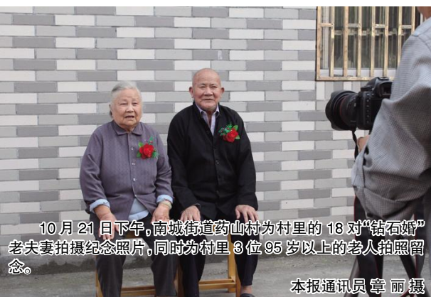
10月21日下午,南城街道药山村为村里的18对“钻石婚”老夫妻拍摄纪念照片,同时为村里3位95岁以上的老人拍照留念。