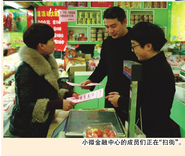
小微金融中心的成员们正在“扫街”。