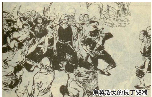
声势浩大的抗丁怒潮