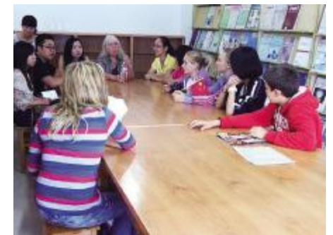
▲记者正在对德国师生进行采访。

德国学生：希望通过这次结对活动，可以增加自己的生活阅历，丰富自己的人生经历，感受一下中国的教育和家庭生活方式。