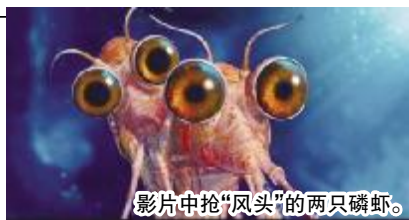
影片中抢“风头”的两只磷虾。

不过,当不知名的力量入侵企鹅王国时,企鹅们表现出了令人难以置信的团结力。马布尔在危急中召集起了所有的动物,从最小的磷虾到巨大的海象,一起抵抗这不明力量。艾瑞克在这些事件中了解到了父亲的勇气和胆略,并最终理解了父亲的良苦用心。