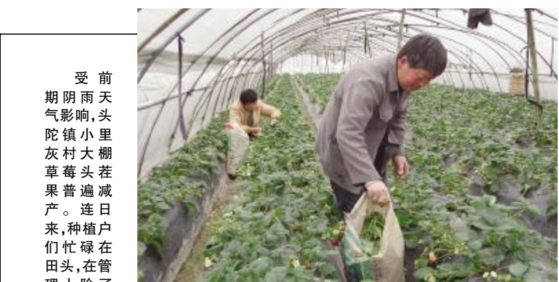
受前期阴雨天气影响,头陀镇小里灰村大草莓头茬果普遍减产。连日来,种植户们忙碌在田头,在管理上除了控制好温、湿度、肥料外,还加强病虫害防治等工作,争取二茬果有个好收成。

针对查找出来的问题,该局高度重视,坚持即知即改、边评边改、以评促改、纠建并举的原则,针对征求到的意见建议中提到的问题立即着手整改,逐一分解到相关科室,落实责任人,限定整改时限,督促落实到位。