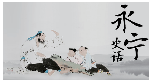
主办: 区政协文史委 承办: 区历史学会、道台里文创院