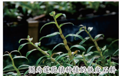
图为莲花镇种植的铁皮石斛

以齐平新村为试点，开展庭院经济实验项目，在35位农户的庭院里摆放高约1.3米的铁皮石斛种植架，通过龙头带动、项目引领等方式助农增收。