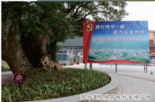
图为莲花镇昂畈村香樟广场