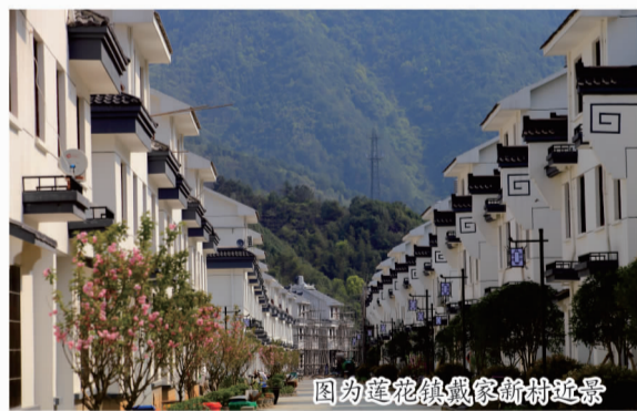
图为莲花镇戴家新村近景

为巩固治水成果，今年莲花镇趁势而上，打好转型升级组合拳，以打造花果小镇为目标，将“党员引领、巾帼示范、全民参与”三者相结合，推进农村环境综合整治，在S303省道沿线、精品村等重点区域整治赤膊墙5000余平方米，对村庄36处墙体进行改造，开展为期2个月的道路大中修，拆除公路两侧私搭乱建65处。