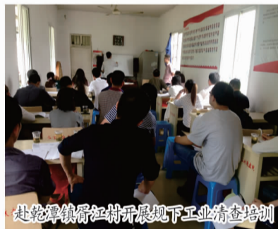
赴乾潭镇晋江村开展规下工业清查培训

模以下工业清查，建立农业经营主体联系制度。同时还开展了《巩固国家卫生城市成果调查》、《住房公积金宣传效果调查问卷》等9项专项调查，客观反映社会公众需求，搭建市委市政府与公众沟通的“桥梁”。