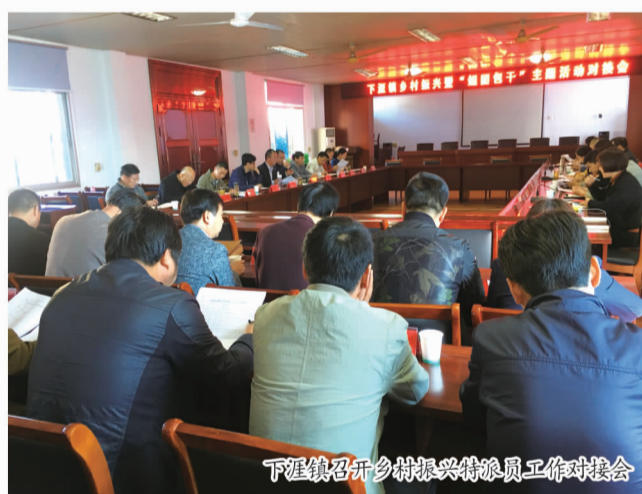
下涯镇召开乡村振兴特派员工作对接会

美丽生态与现代风情交相辉映的下涯镇，江湾村犹如座落在新安江主城区的“后花园”。乍暖还寒的清晨，车子驶过白章线上那处标志性的“高畈弯”，就进入了江湾村地