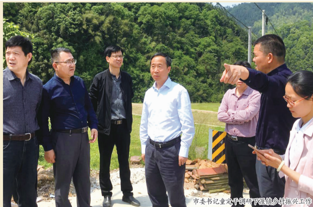
市委书记童定干调研下涯镇乡村振兴工作

根据市委选派乡村振兴特派员的工作部署，4月份是乡村振兴特派员的专题调研月。以大调研推进大振兴，扎实有效的调查研究，是打好村集体经济“消薄”攻坚战、推进乡村振兴的前提。在下涯镇，乡村振兴特派员下村集中调研已有一个月时间，特派员们的解题“进行曲”，经过紧锣密鼓的走访、调研，交上了“第一张考卷”。