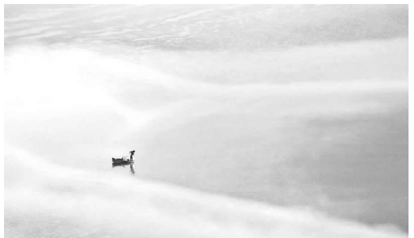
佳作奖晨捕