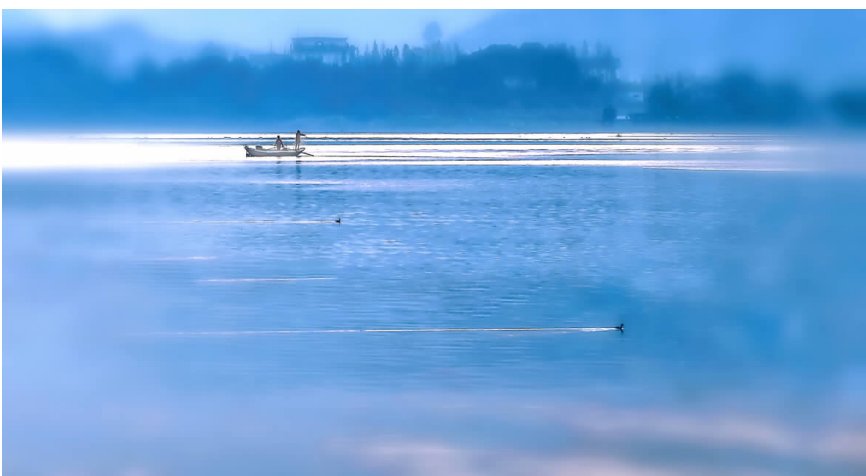
佳作奖牧渔归