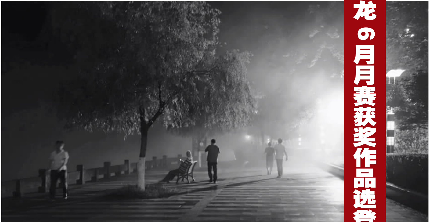
佳作奖夏夜