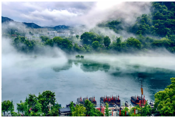
佳作奖新安江之冬夏