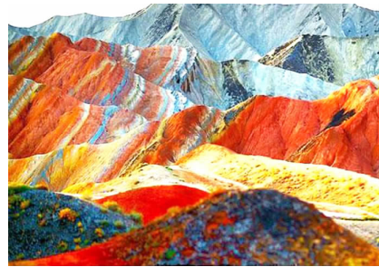
旅游淡旺季明显 7月至9月赏最美西北

甘肃拥有丹霞地貌与彩色丘陵的张掖丹霞地质公园，不仅是摄影爱好者的天堂，也是备受导演青睐的取景地。张艺谋的《三枪拍案惊奇》、姜文执导的《太阳照常升起》和电视剧《神探狄仁杰》都曾在此取景，充分展现了当地的奇特风光。