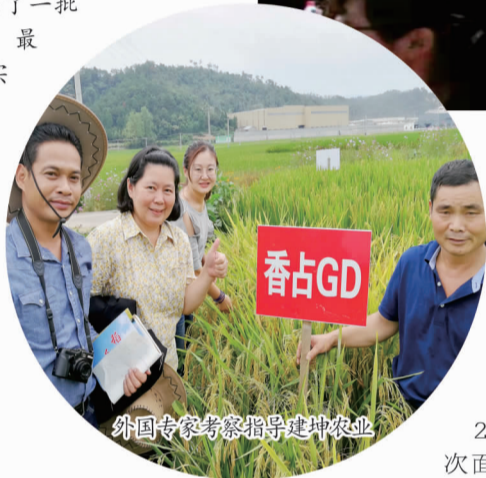
外国专家考察指导建坤农业

新时代、新气象、新征程。2018年，市人力资源和社会保障局以党建为引领，抓班子带队伍，强执行促落实，坚持把作风建设作为落实主体责任的核心抓手，坚持把履职尽责作为目标追求，坚持把修身理政、廉洁从政、依法行政作为根本保证，坚持“民生为本、人才优先”工作主线，全力推进就业创业、社会保障、人事人才、和谐劳动关系等各项工作，积极有为、勇于担当，解决了一批群众最关心、最需要解决的的实际困难和问题，人力资源和社会保障各项工作亮点纷呈，交出了一份老百姓满意的答卷。