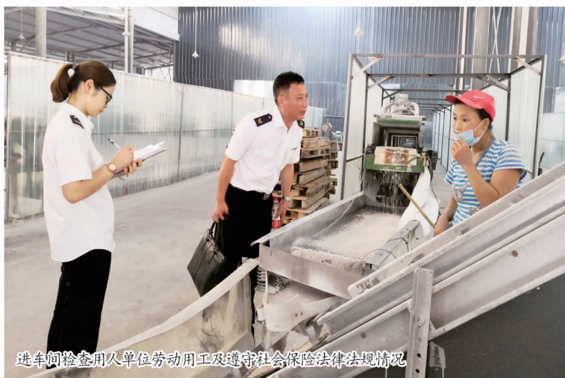
进车间检查用人单位劳动用工及遵守社会保险法律法规情况

2018年，市人社局围绕中心工作，强化党建引领，倾力打造“贴心人社360”党建品牌。通过微党课、微平台、微竞赛突出廉政教育，建立完善“两单两书两述”工作机制，压实各级责任，狠抓内部防控，规范权力运行，深入开展扶贫领域腐败和作风问题专项治理，将党建品牌“贴心人社360”与服务民生职能紧密结合，引领人力社保事业健康持续发展。在杭州市建设清廉机关创建模范机关暨机关党建质量提升工程推进会上，我市“贴心人社360”党建品牌作为参观学习点，获得与会者一致好评。目前，该党建品牌已成功入选我市机关党建十佳品牌。