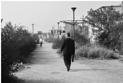
整修前的大坝坝顶