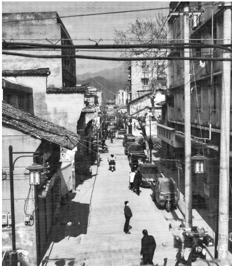
整修前的南门头 韩承义 摄