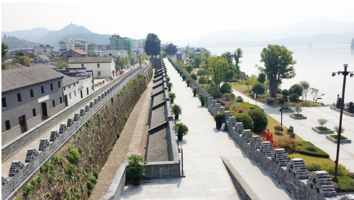
整修后的大坝坝顶