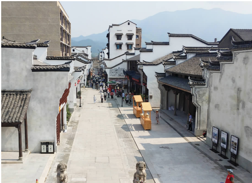
梅城南大街