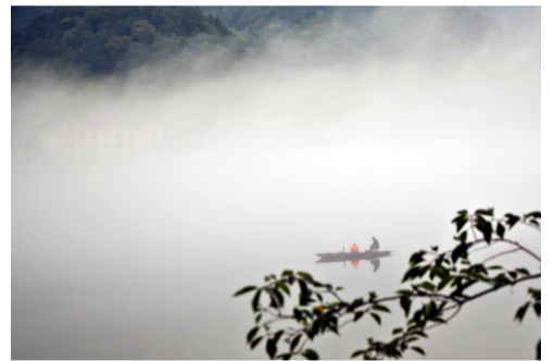
雾海渔舟