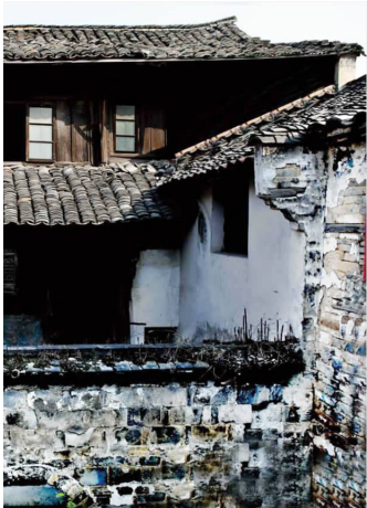
郑家老屋

郑家老屋位于梅城镇三星街程家弄10号，为清中期建筑，占地面积229平方米，呈三合院格局。该老屋为作家郑秉谦故居。其祖父郑保铨，清末民初首创建德女学，后经营郑天元杂货店。