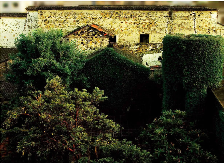
方家老屋