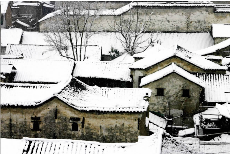
戴家老屋

胡家老屋位于梅城镇正大街三板桥5号，为清末建筑，占地面积为1520平方米，四进院落，有13个天井，为商号“胡亨茂”的旧址。严州巨商胡亨茂在严州极有影响，其主要经营南北货、五加皮酒业等。