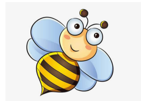
乾潭一小三（3）班 徐梓卉 指导老师 蔡春兰

轻地挥手将翁雨萱身边的蜜蜂扇开了。翁雨萱战战兢兢地从桌子底下钻出来坐好，与同学们继续齐声朗读，这小小的“不速之客”也跟着我们一起学习。 这真是有趣的一堂课！ 寿昌二小 402 班 李雅利 指导老师 蒋婷