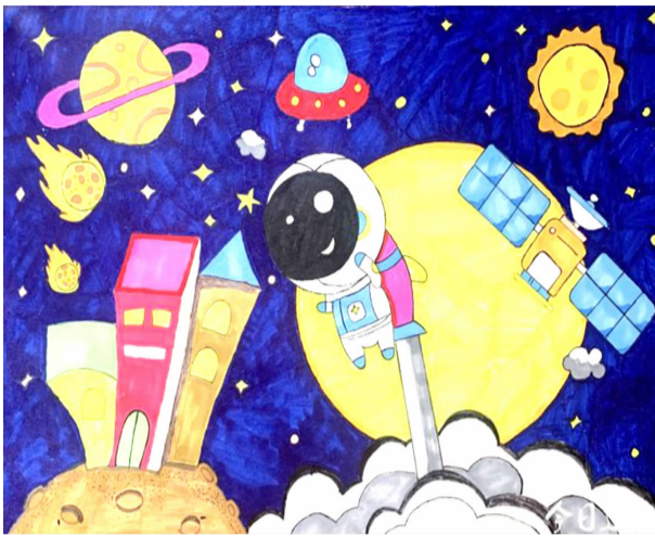
太空遨游 大洋中心小学五（1）班 张雨熙