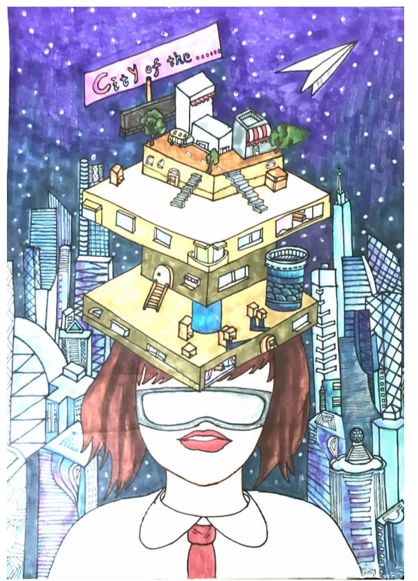
未来城市 乾潭二小六（4）班 陈丽洁 指导老师 方程