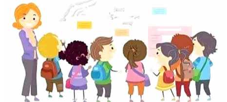
明珠小学四（2）班 何尚恩 指导老师 陈彩虹

们来到了另一个展厅，这里有很多动物、植物等的模型，这些模型栩栩如生，看得我眼花缭乱。看！那些蛇的模型，还挺吓人的。我让爸爸拍了好多照片，这样回家可以慢慢欣赏。 我们一直参观到十一点才依依不舍地离开，我想我以后还会再来的。 寿昌一小 302 班 唐子瑜 指导老师 叶飞