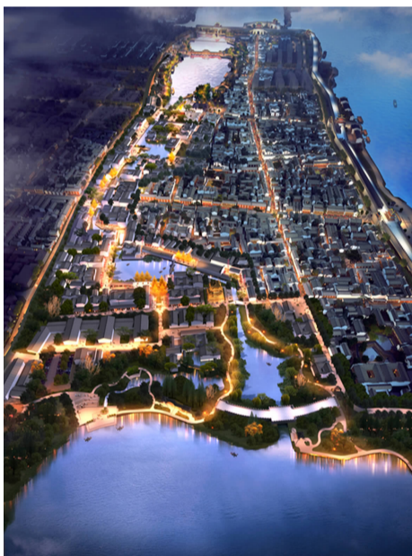
玉带河夜景效果图