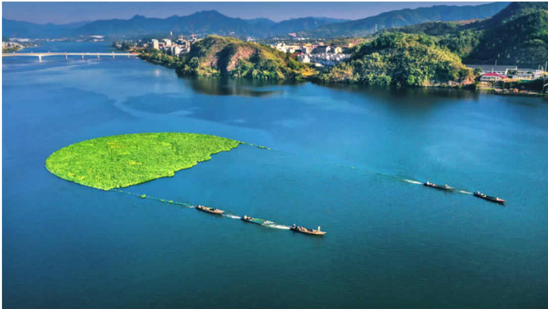
打造最美新安江

一头连着千岛湖，一头汇入钱塘江，这是17℃的建德新安江水。新安江水的独特，不仅在水温，更在安全，在生态，在幸福。