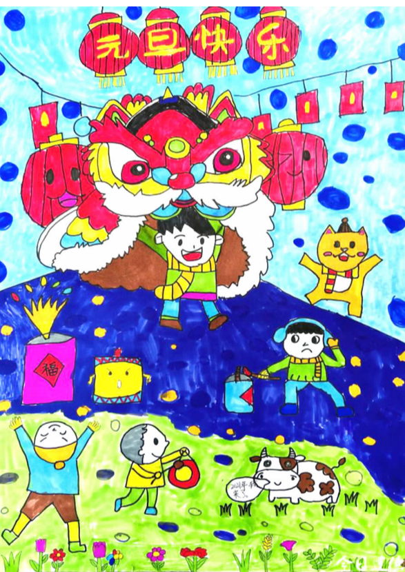
新年舞狮 大同一小 303 班 周希恩