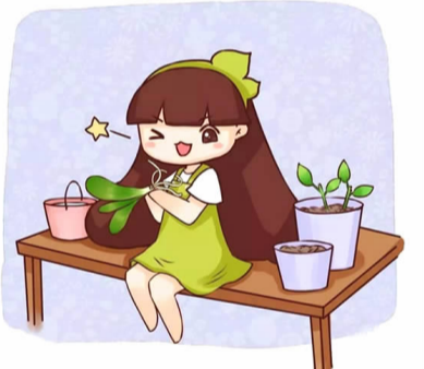
寿昌二小 601 班 周缘澳 指导老师 蔡伟春