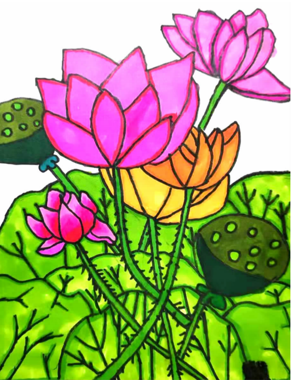
莲 梅城小学五(4)班 方欣瑶 指导老师 孙琪