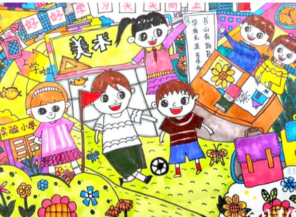
我们的校园 实验小学一(4)班 夏彦翔