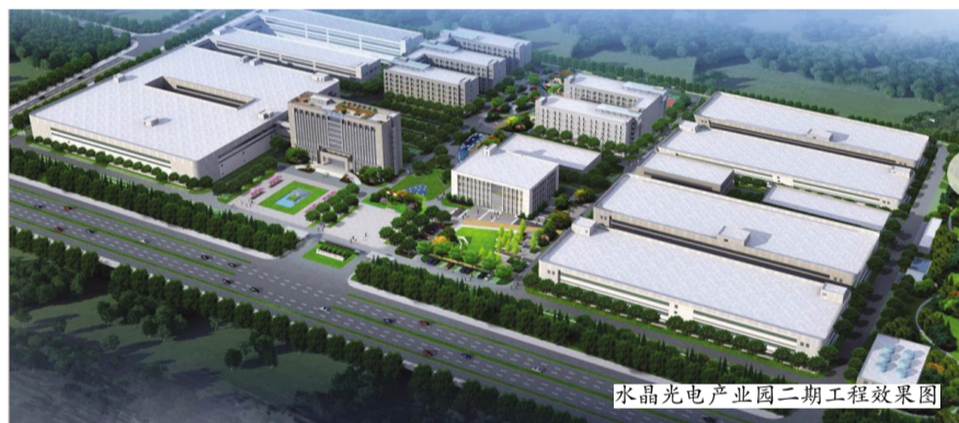
水晶光电产业园二期工程效果图

水晶光电二期项目开工后,我区还分别举行了太和山隧道工程和前所眼镜小微企业创业园项目的开工仪式。