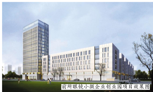
前所眼镜小微企业创业园项目效果图

水晶光电产业园二期工程占地150亩,总投资20多亿,其中,年产7.5亿套蓝玻璃及生物识别滤光片组件技改项目,投资10.06亿。二期项目的建设将推进人脸识别、虹膜识别、虚拟显示、3D打印等前沿产业的发展,为我区高科技产业发展带来新的亮点。