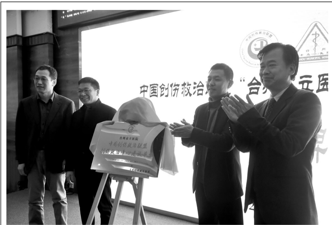
近日,中国创伤救治联盟“台州市立医院创伤中心”建设单位签约揭牌仪式在台州市立医院举行。该中心成立后,台州市立医院将在中国创伤救治联盟的指导下,积极推进各项建设工作,提高我区的综合急救能力及严重创伤救治能力,为城乡居民提供更加优质高效和安全快捷的医疗急救服务。