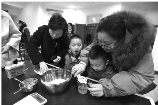
1月21日,在海门街道枫南社区,孩子们正在家长和老师的指导下分享学习做蛋糕的乐趣。当日,该社区的免费公益课堂正式开课了,每逢周末,公益课堂都将为小朋友们开设各种课程,此举受到了家长和孩子们的欢迎。

该局坚持“企业为主体、部门协调、政府主导”的发展思路,引导企业健全品牌管理体系,提升品牌质量水平、夯实品牌发展基础、打响品牌知名度,对争创企业做好培育指导、协调和帮扶。同时,围绕商标、名牌产品和标准制定对企业发展的作用、政府支持政策和树立品牌价值理念优势等重点内容,加大宣传力度,帮助企业提升品牌意识,营造品牌建设氛围。该局还依法严厉打击商标侵权假冒、伪造冒用他人厂名厂址、无证生产等违法行为,为企业发展营造公平竞争的市场环境,促进全区企业质量水平整体提升。