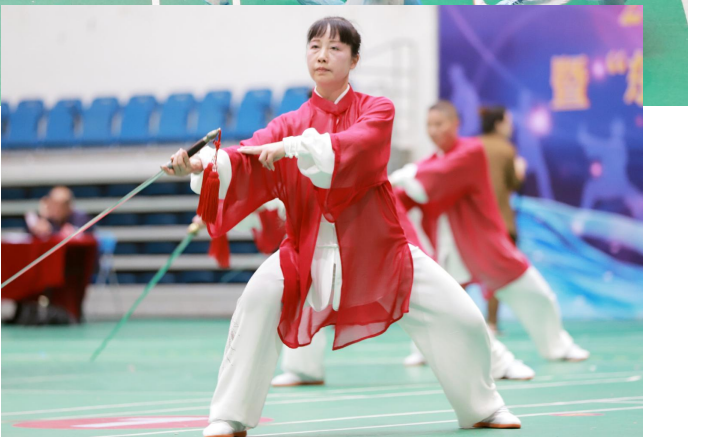
本报记者 陈胡南 文/图

日前,第五届浙江省太极拳公开赛在我区举行,来自全国、全省各地的太极拳协会、武术俱乐部、武术协会36支队伍共计609名太极拳爱好者,齐聚椒江,展示太极魅力,弘扬传统文化。 从比赛现场来看,太极拳表演形式多样,可单人、可对练、亦可集体、年龄横跨儿童、少年、青年、中年、老年,可赤手空拳,可配合道具,服装、造型千姿百态。表演者动作或刚毅有力或飘逸轻灵,刚柔并济,动静咸宜。